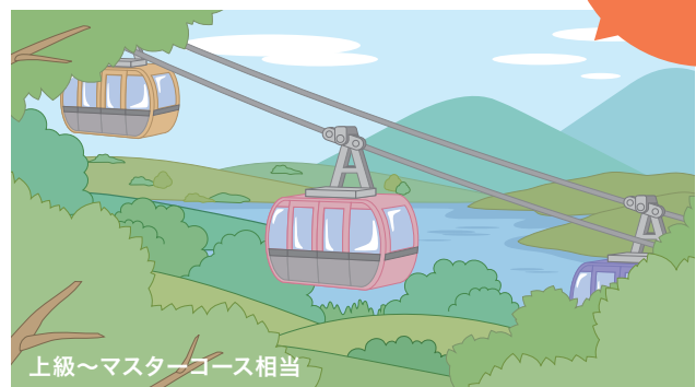
上級～マスターコース相当